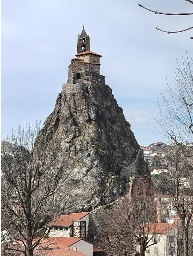
L'église Saint-Michel in Aiguilhe in departement Haute-Loire, Frankrijk